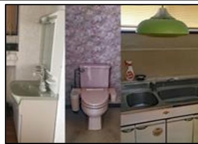
2階洗面台・トイレ・キッチン