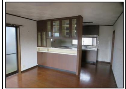
カウンター付き食器棚