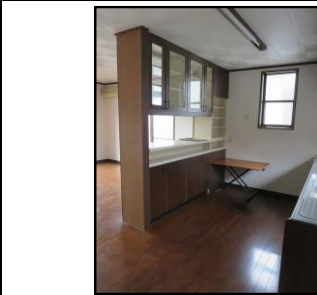
カウンター付き食器棚2