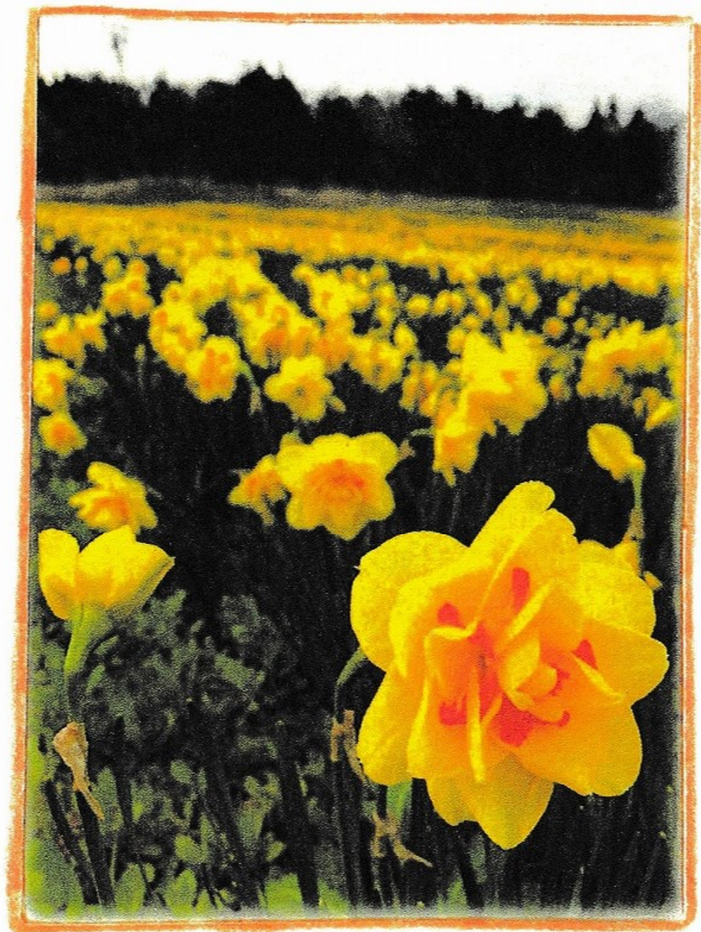
夢の平スキー場のスイセン

今は、「石戸波に来られ」と 言えないのがもどかしいですが、 紙面で楽しんでもらえると、 うれしいです。