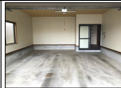
インナーガレージ