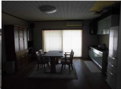
キッチン・ダイニング