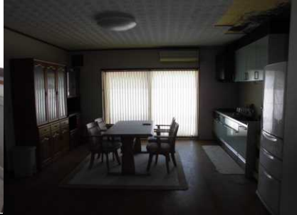
キッチン・ダイニング