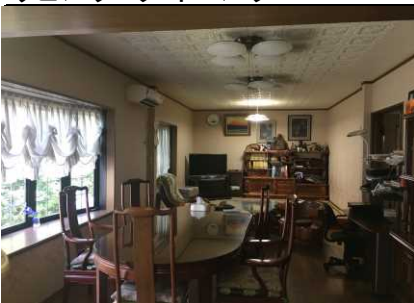
リビング・ダイニング